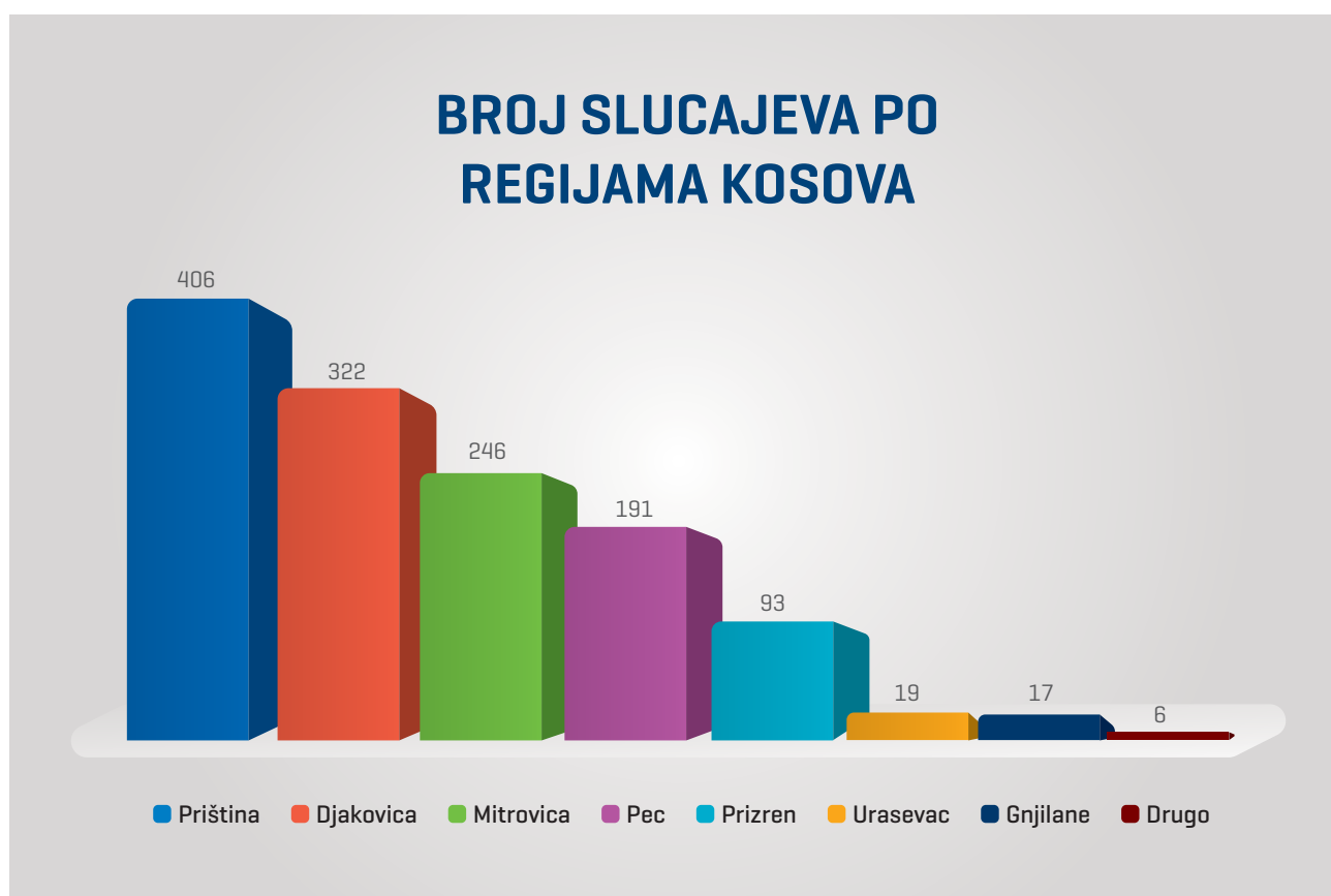
Slika 1. Ovaj trakasti dijagram prikazuje regione Kosova u kojima su dokumentovani incidenti seksualnog nasilja u sukobu.

Primer u nastavku prikazuje trakasti grafikon regiona za koje su do danas dokumentovani incidenti seksualnog nasilja: