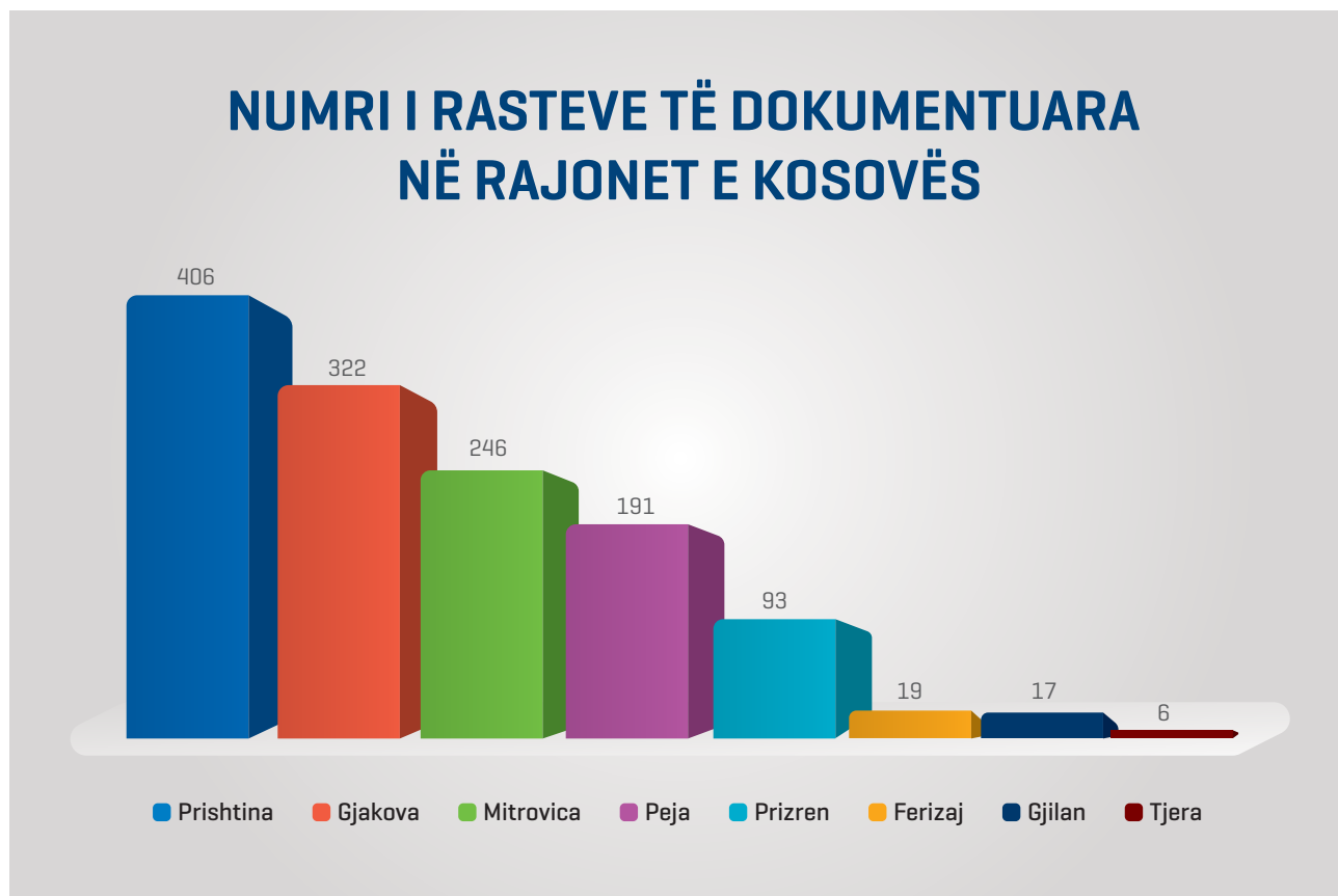
Figura 1. Ky grafik me shtylla tregon rajonet e Kosovës ku janë dokumentuar ngjarje të dhunës seksuale në konflikt.

Shembulli i mëposhtëm tregon një grafik me shtylla të rajoneve për të cilat ngjarjet e dhunës seksuale janë dokumentuar deri më tani: